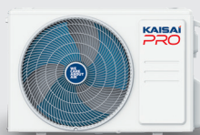
Външно тяло KRP